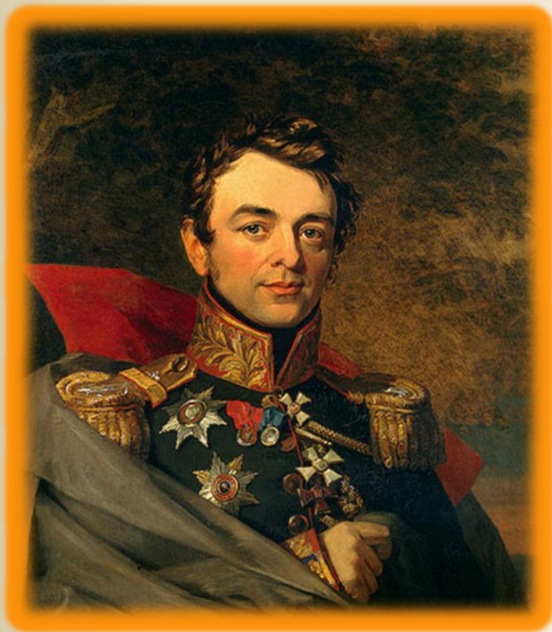
Генерал-фельдмаршал светлейший князь Иван Фёдорович Варшавский, граф Паскевич-Эриванский