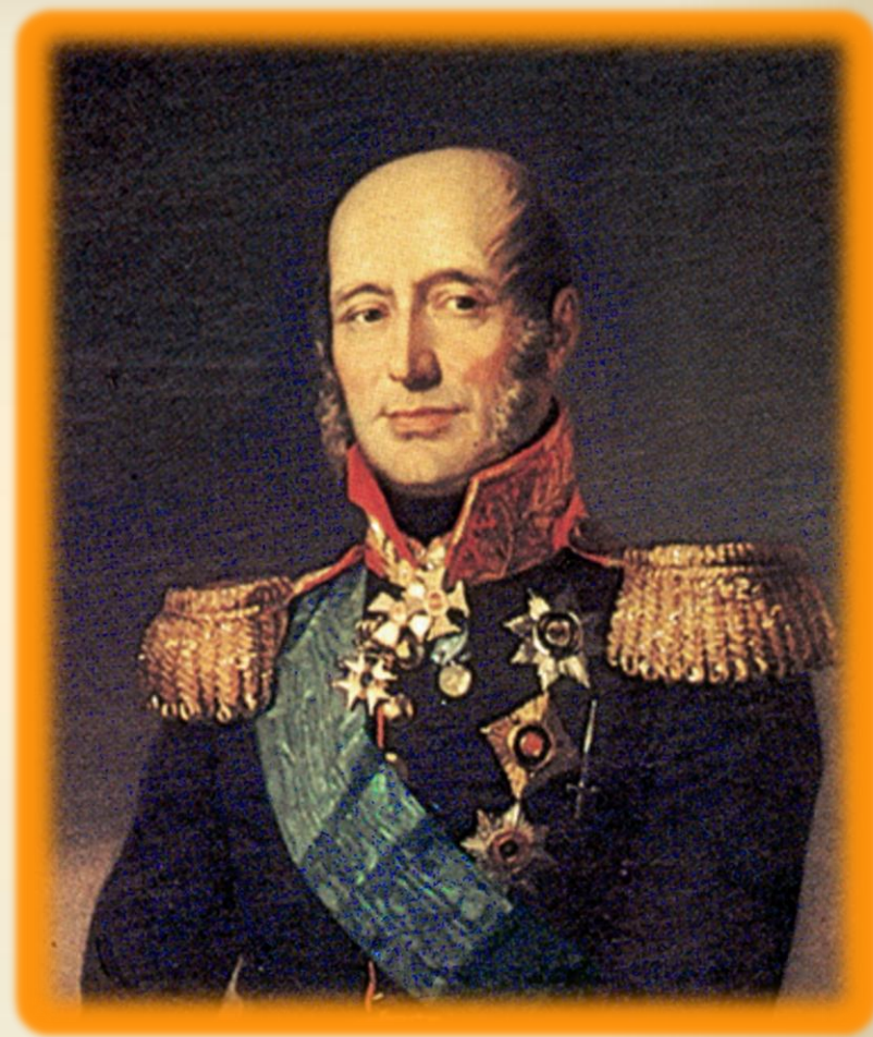
Генерал-фельдмаршал князь Михаил Богданович Барклай-де-Толли