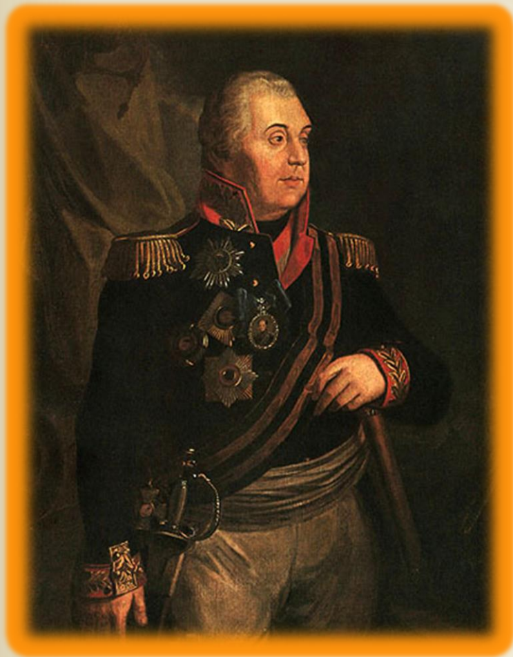
Генерал-фельдмаршал светлейший князь Михаил Илларионович Голенищев- Кутузов-Смоленский