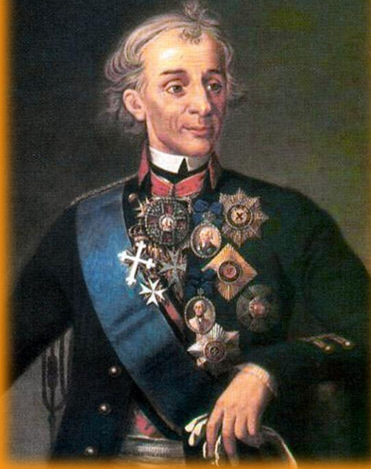
Генералиссимус князь Александр Васильевич Италийский, граф Суворов-Рымникский