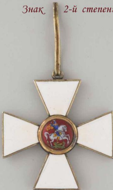
Знак 2-й степени