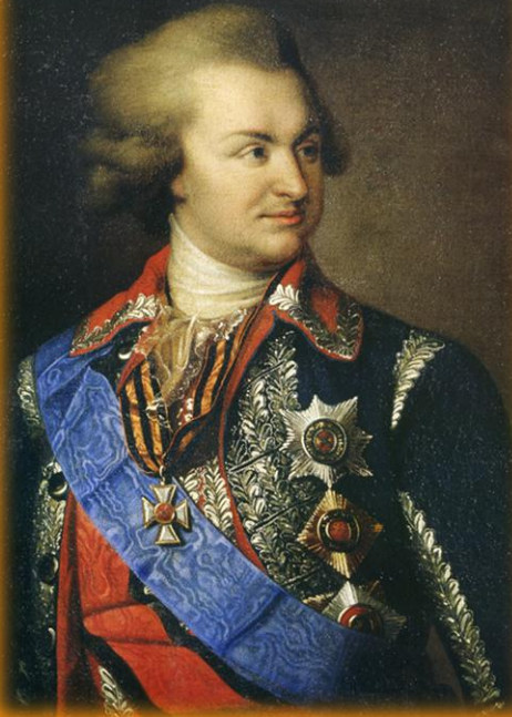
Генерал-фельдмаршал светлейший князь Григорий Александрович Потёмкин -Таврический