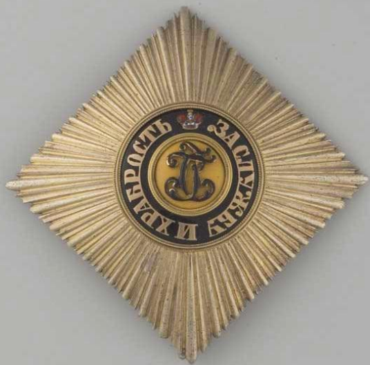
Звезда к ордену Св. Георгия