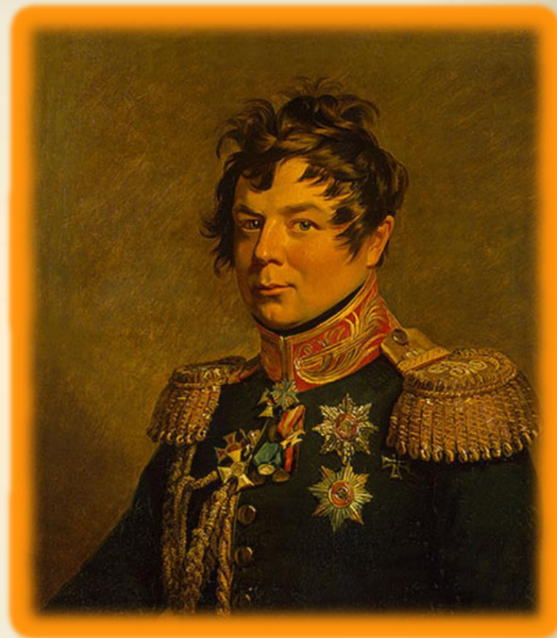
Генерал-фельдмаршал граф Иван Иванович Дибич-Забалканский