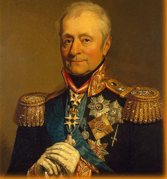
Генерал от кавалерии граф Леонтий Леонтьевич Беннигсен