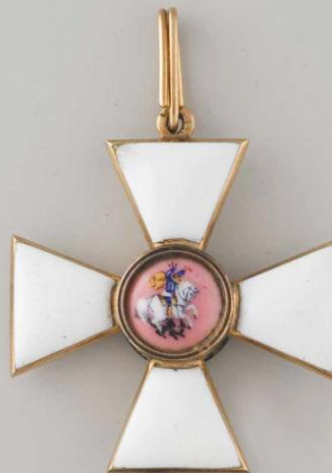
Знак 3-й степени